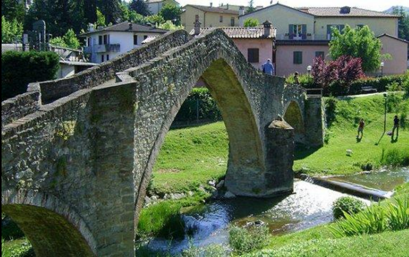
Modigliana – ponte della Signora

Mercoledì 31 luglio – dal rifugio del Parco a Modigliana – km 17