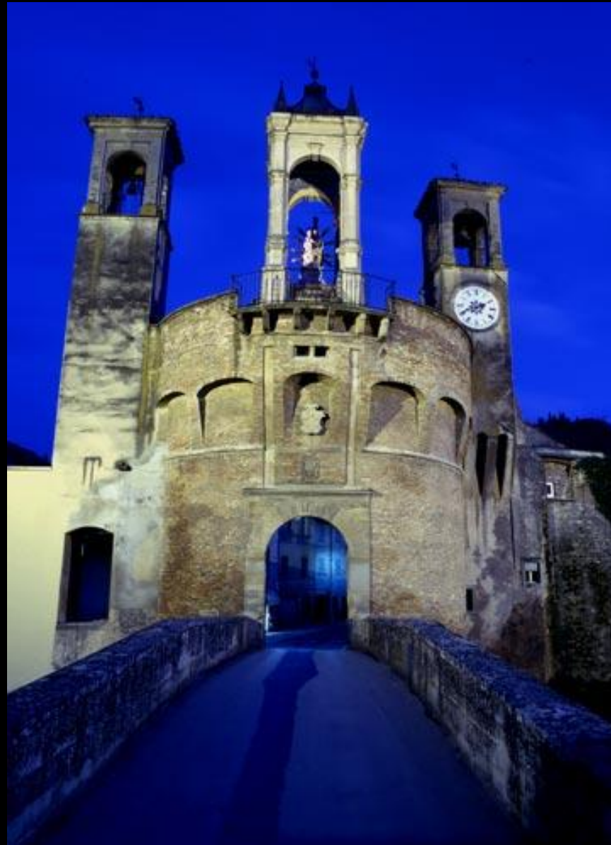
Modigliana – la Tribuna

Mercoledì 31 luglio – dal rifugio del Parco a Modigliana – km 17