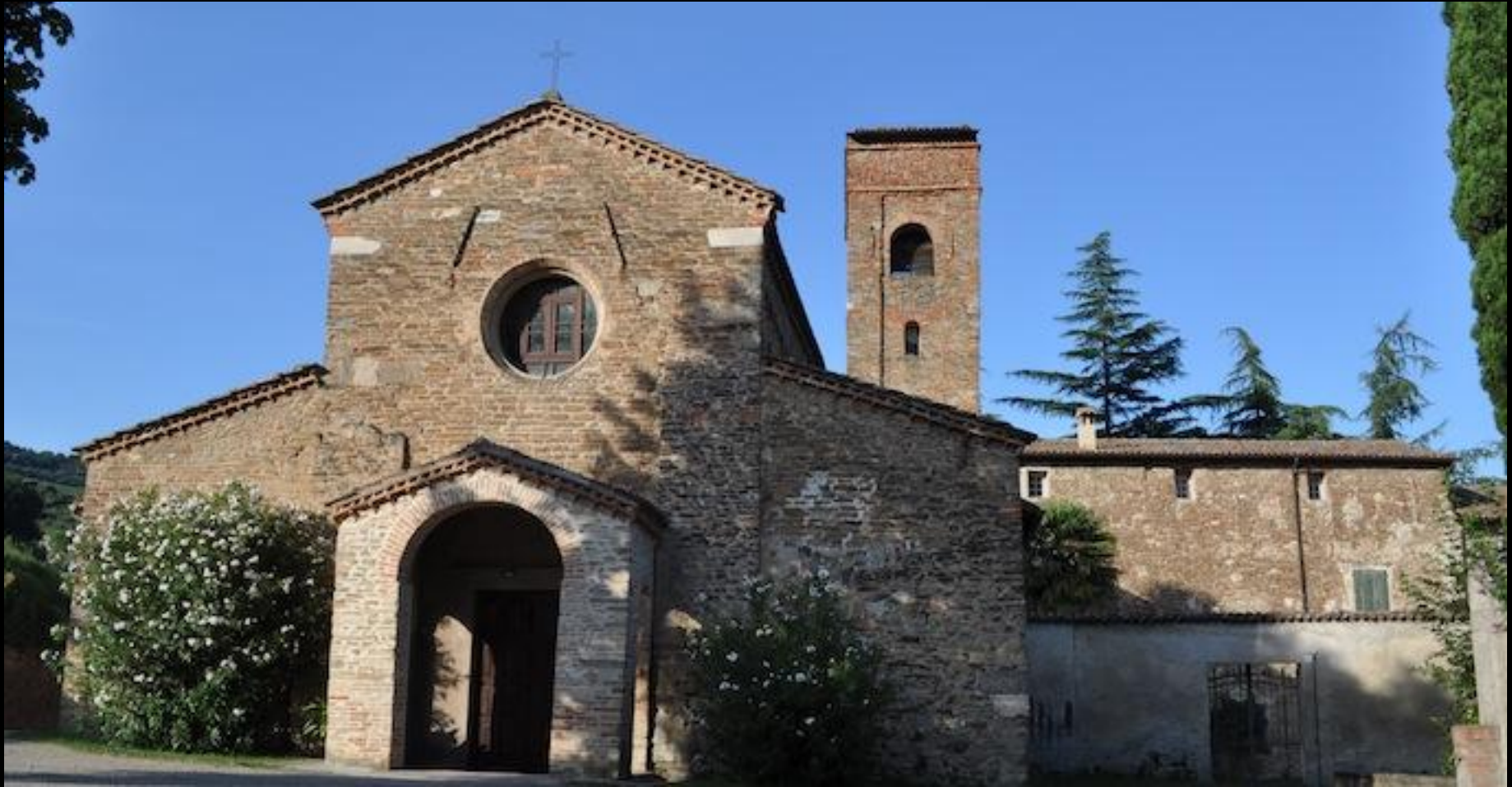
Pieve di Santa Maria in Tiberiaco

Martedì 30 luglio – da Tossignano al Parco naturale del Carnè – km 23, con pernottamento al rifugio del Parco