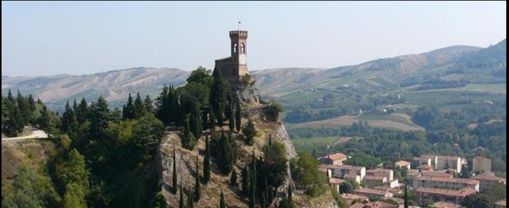
Brisighella Terme, con la Rocca Manfrediana

Mercoledì 31 luglio – dal rifugio del Parco a Modigliana – km 17